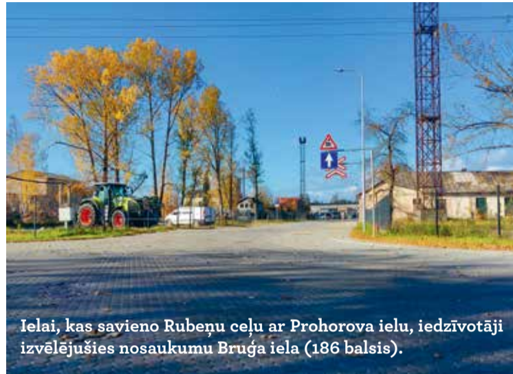
Ielai, kas savieno Rubeņu ceļu ar Prohorova ielu, iedzīvotāji izvēlējušies nosaukumu Bruģa iela (186 balsis).

Iedzīvotāji līdz 31. oktobrim vietnē Jelgava.lv bija aicināti piedalīties aptaujā un nobalsot par jauno ielu Lielupes industriālā parka teritorijā nosaukuma variantiem. Ielai, kas savieno Rubeņu ceļu ar Prohorova ielu, iedzīvotāji izvēlējušies nosaukumu Bruģa iela (186 balsis). Savukārt piebraucamajam ceļam no Rubeņu ceļa puses iedzīvotāji izvēlējušies nosaukumu Gala iela (166 balsis). Kopumā aptaujā saņemti 507 balsojumi.