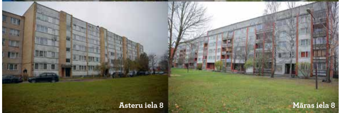
Asteru iela 8