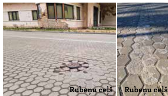
Rubeņu ceļš Rubeņu ceļš

2021. gada rudenī izbūvēts Rubeņu ceļa posms. Apekojot objektu, konstatēts, ka Rubeņu ceļa posmā no Garozas ielas līdz Loka maģistrālei ir plaisas asfalta segumā. Visā jaunbūvētajā Rubeņu ceļa posmā – no Neretas ielas līdz Garozas ielai – atkārtoti konstatētas pelēkā un sarkanā betona bruģakmens seguma diluma un drupšanas pazīmes, vairākās vietās kopā ar bruģakmens segumu ir iesēdušās kapes – komunikāciju aku vāki, kā arī ietves daļā ir sašķēlies granīta bruģakmens un vietām nodilis horizontālais marķējums.