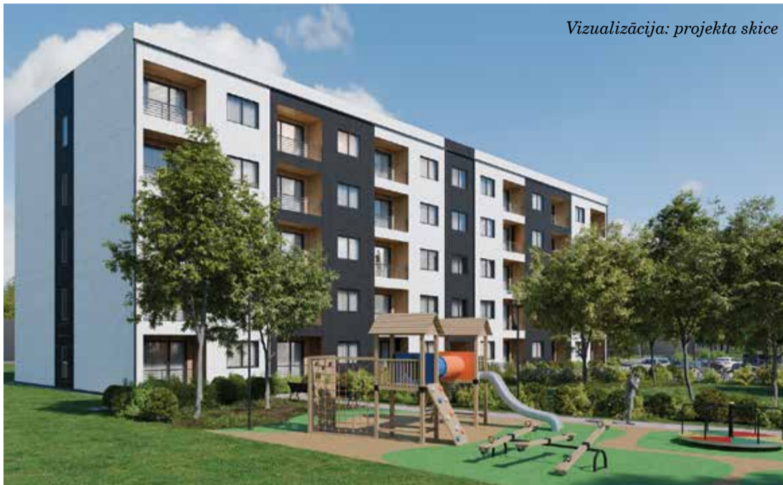
Vizualizācija: projekta skice

IEDZĪVOTĀJU IEVĒRĪBAI: autostāvlaukums no Ganību ielas 54 pārvietots uz Saldus ielu 42A