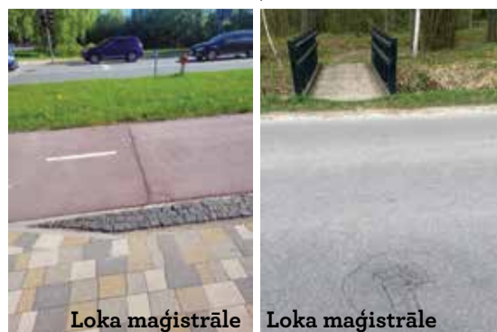
Loka maģistrāle Loka maģistrāle

2021. gada rudenī izbūvēts Rubeņu ceļa posms. Apekojot objektu, konstatēts, ka Rubeņu ceļa posmā no Garozas ielas līdz Loka maģistrālei ir plaisas asfalta segumā. Visā jaunbūvētajā Rubeņu ceļa posmā – no Neretas ielas līdz Garozas ielai – atkārtoti konstatētas pelēkā un sarkanā betona bruģakmens seguma diluma un drupšanas pazīmes, vairākās vietās kopā ar bruģakmens segumu ir iesēdušās kapes – komunikāciju aku vāki, kā arī ietves daļā ir sašķēlies granīta bruģakmens un vietām nodilis horizontālais marķējums.