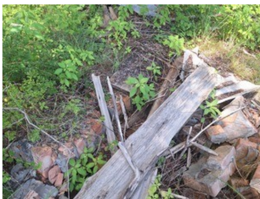
1.2.8-2 Noliktava 09000230012035