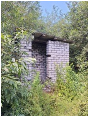
1.2.6-1 Ateja ar kadastra apzīmējumu 0900 023 0012 040