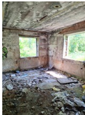
1.2.2-2 Sargu māja ar kadastra apzīmējumu 0900 023 0012 012