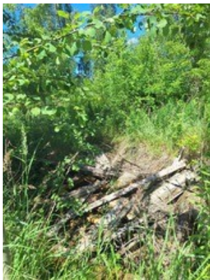
1.2.9-1 Noliktava 09000230012036