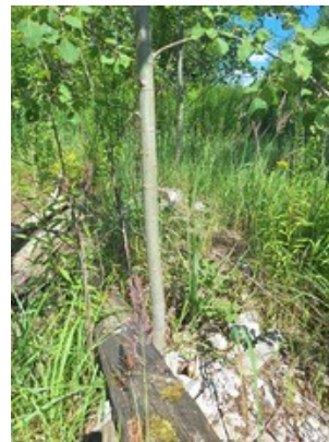
1.2.9-2 Noliktava 09000230012036