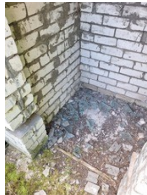
1.2.6-2 Ateja ar kadastra apzīmējumu 0900 023 0012 040