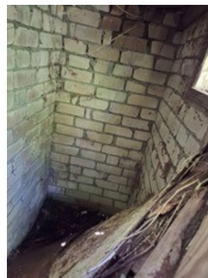
1.2.7-2 Tualetes ēka ar kadastra apzīmējumu 0900 023 0012 039