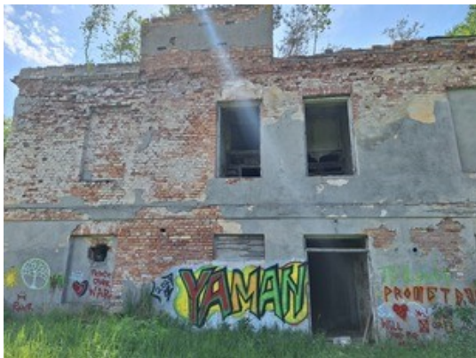
1.2.5-1 Administratīvā ēka ar kadastra apzīmējumu 0900 023 0012 016