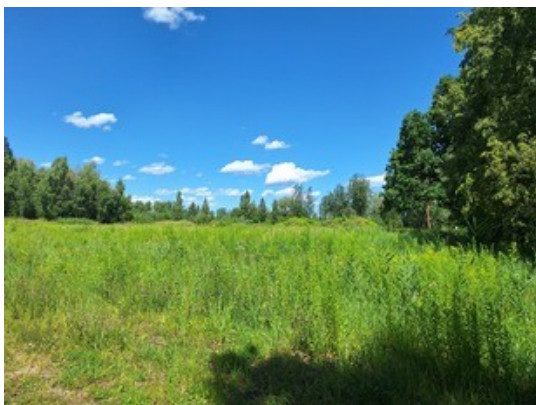
1.2.10-1 Virszemes metāla rezervuāri 09000230012054