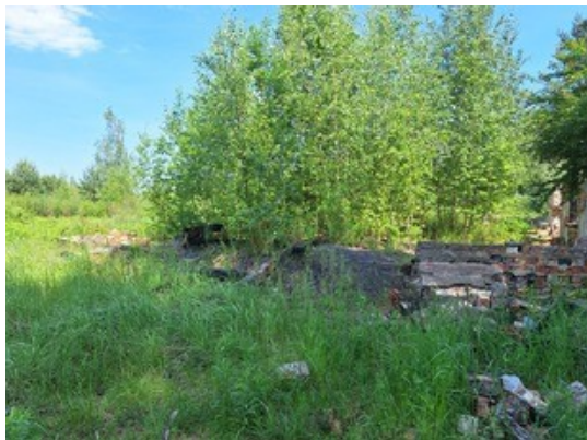
1.2.4-1 Laboratorija ar kadastra apzīmējumu 0900 023 0012 020