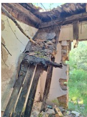
1.2.5-3 Administratīvā ēka ar kadastra apzīmējumu 0900 023 0012 016