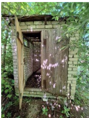
1.2.7-1 Tualetes ēka ar kadastra apzīmējumu 0900 023 0012 039