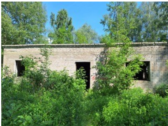
1.2.2-1 Sargu māja ar kadastra apzīmējumu 0900 023 0012 012