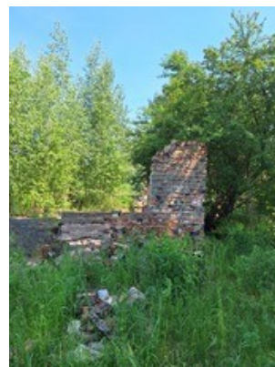
1.2.3-2 Noliktava ar kadastra apzīmējumu 0900 023 0012 019