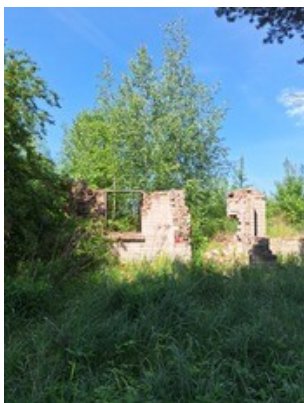
1.2.3-1 Noliktava ar kadastra apzīmējumu 0900 023 0012 019