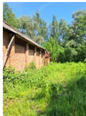
1.2.1-3 Noliktava ar kadastra apzīmējumu 0900 023 0012 011