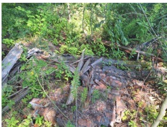
1.2.8-1 Noliktava 09000230012035