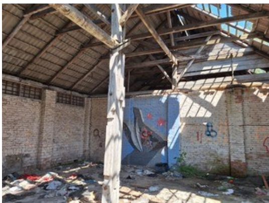
1.2.1-2 Noliktava ar kadastra apzīmējumu 0900 023 0012 011